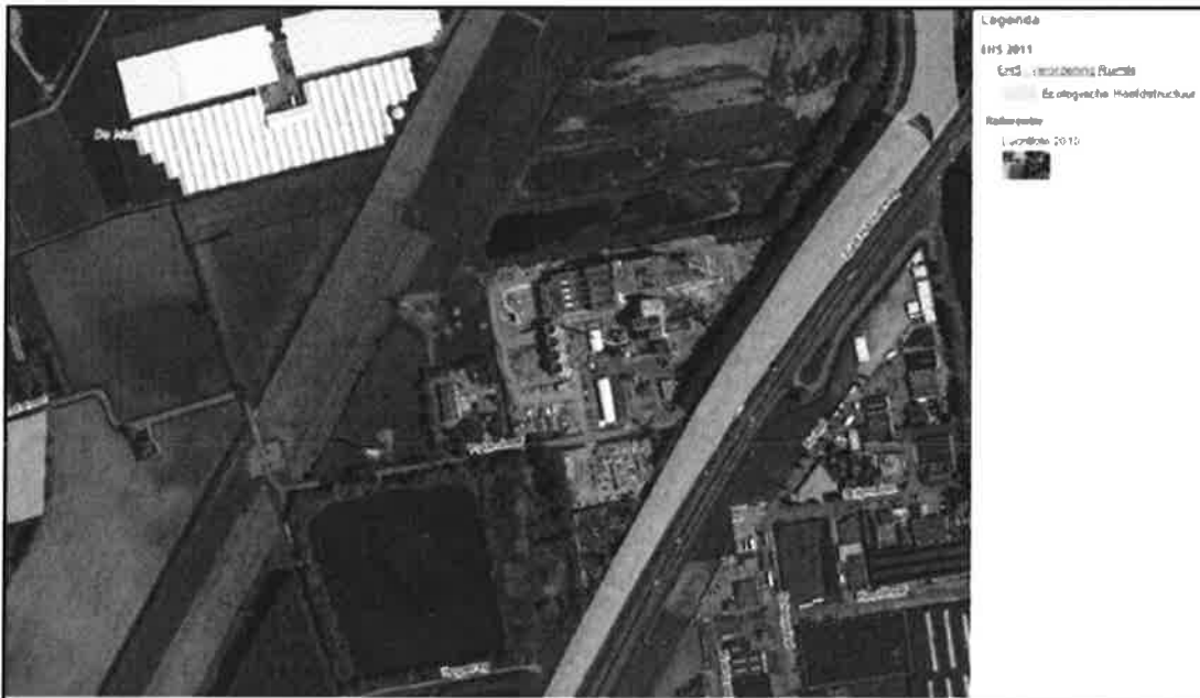
Figuur 3.8 : ligging Ecologische Hoofdstructuur

De projectlocatie is niet gelegen in de nabijheid van gebieden die behoren tot de ecologische hoofdstructuur, met uitzondering van de Rissebeek. Dit gebied is op een afstand van circa 50 meter gelegen van de bedrijfslocatie. Zie de figuur 3.8. De Rissebeek is aangeduid als ecologische verbindingszone. De voorgenomen activiteit leidt niet tot een doorkruising of onderbreking van dit gebied.