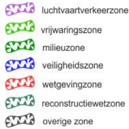
Kaart 1 Evertkreek bestemmingsplan Buitengebied