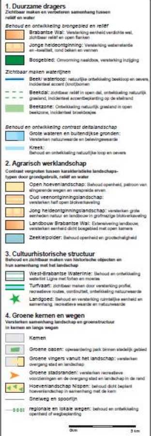
Kaart 2 Kaart als opgenomen in het landschapsontwikkelingsplan