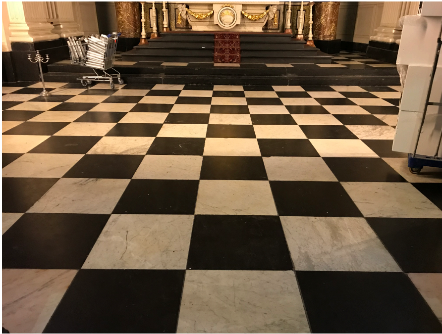
Detail van de historische vloer voor het Hoofdaltaar die gerestaureerd wordt en blijft.