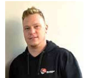
Ad van de Vrede Opbouwwerker WijZijn Traverse

"Ik ondersteun en begeleid mensen die de leefbaarheid in de wijk willen vergroten."