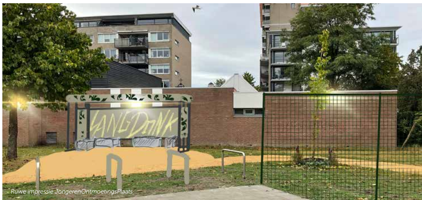
Ruwe impressie JongerenOntmoetingsPlaats