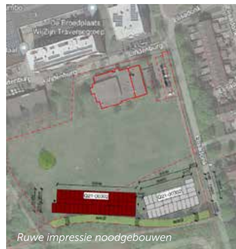
Ruwe impressie noodgebouwen

Op woensdag 3 november heeft een tweede gesprek plaatsgevonden tussen omwonenden van Lindenburg en een afvaardiging van jeugdige inwoners van de wijk. De aanwezigen gaven aan het gesprek als zeer prettig te hebben ervaren. Er wordt gezamenlijk een