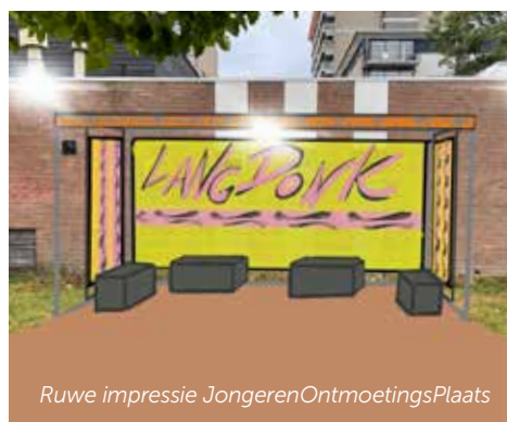
Ruwe impressie JongerenOntmoetingsPlaats