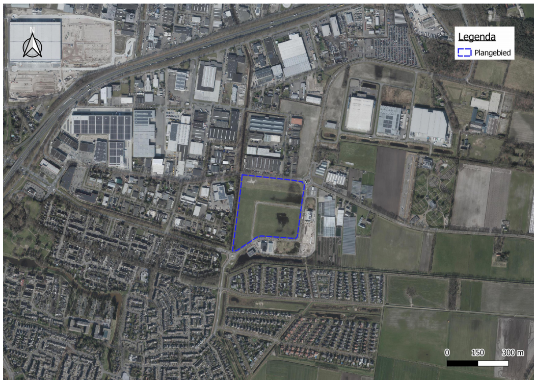
f1.1 Ligging beoogde ontwikkeling

In figuur 1.1 is de ligging van Cloetta in de omgeving weergegeven.