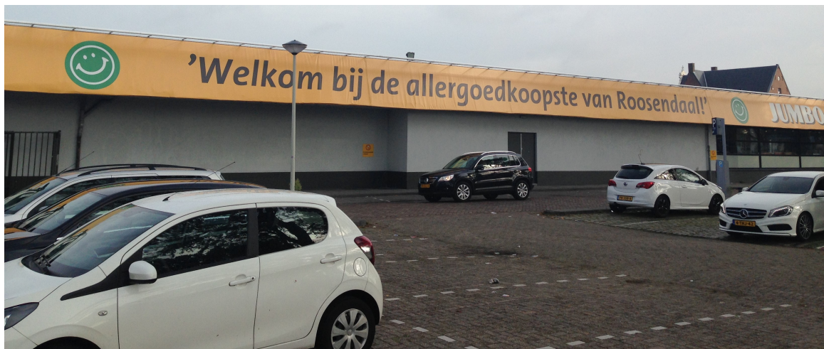
Vervolg figuur 2. Foto-impresie van het plangebied van de supermarkt aan de Van Beethovenlaan te Roosendaal (onderste twee foto's; bestaande supermarkt).