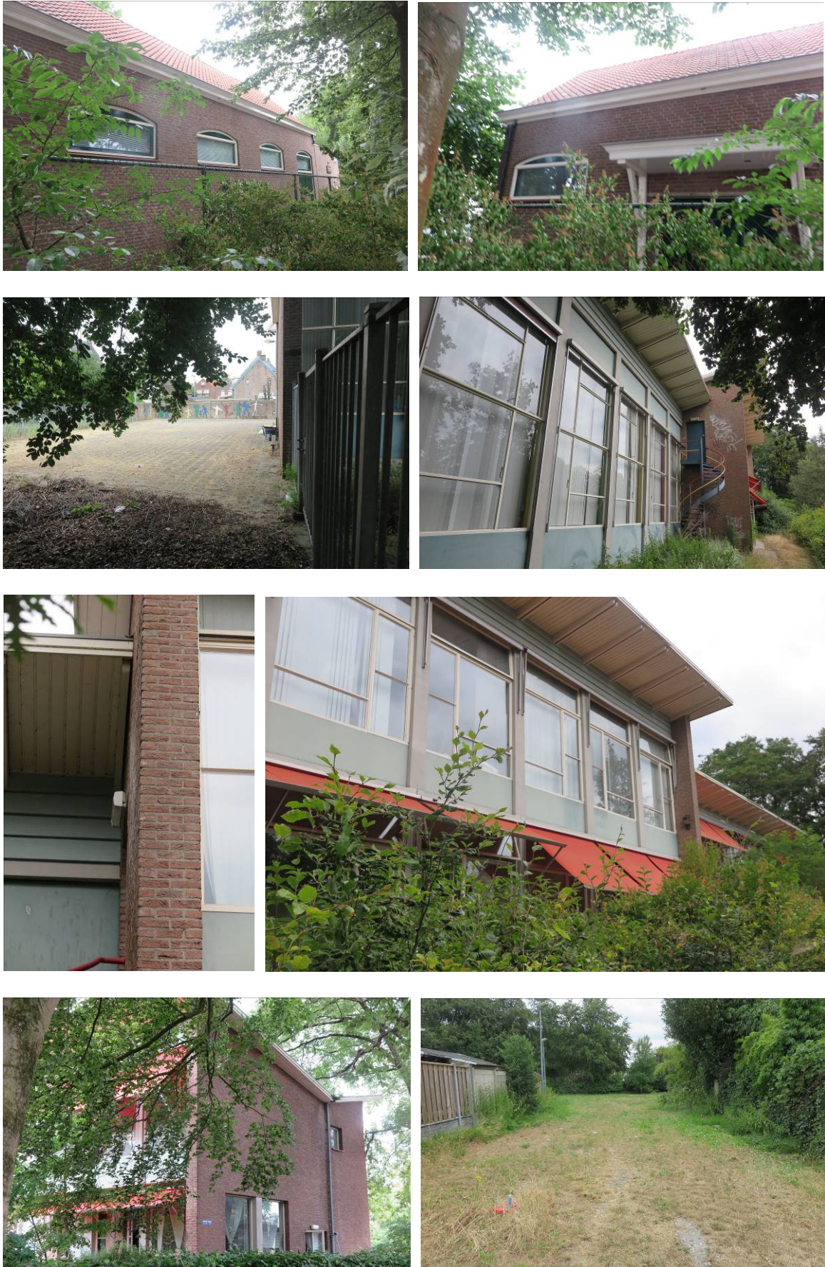
Vervolg figuur 2. Foto-impresie van het plangebied van de supermarkt aan de Van Beethovenlaan te Roosendaal.