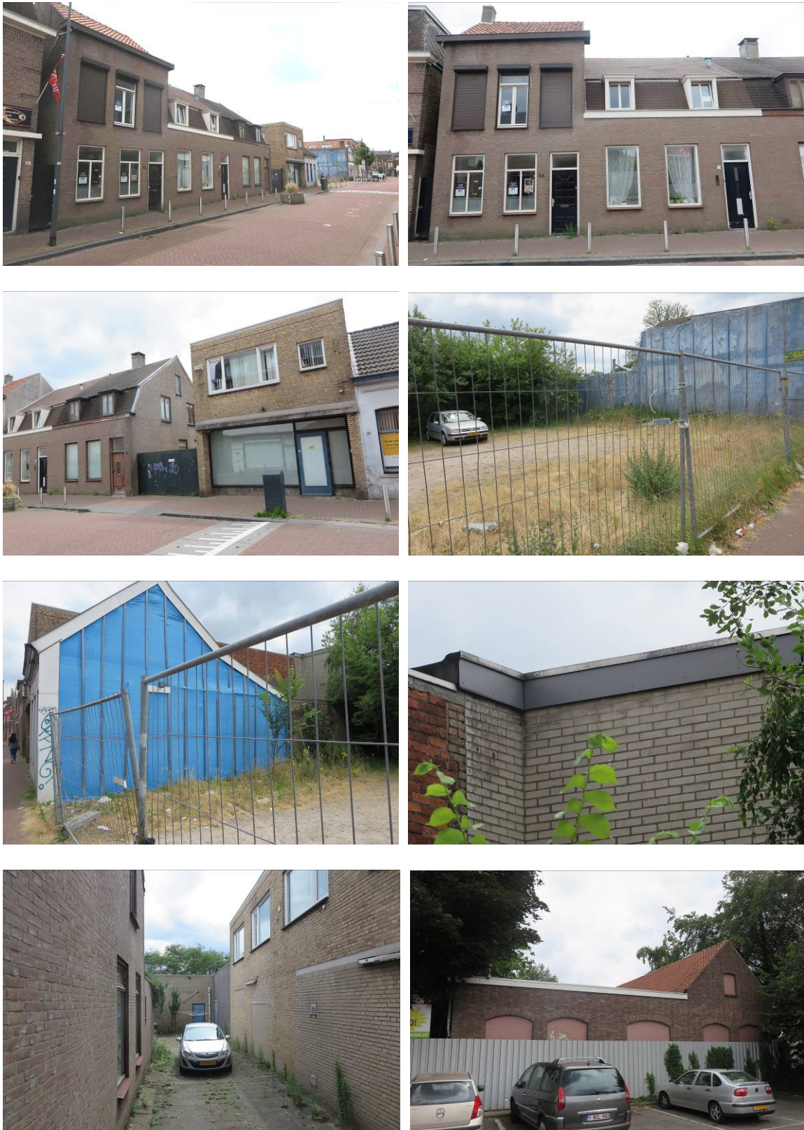
Figuur 2. Foto-impresie van het plangebied van de supermarkt aan de Van Beethovenlaan te Roosendaal.