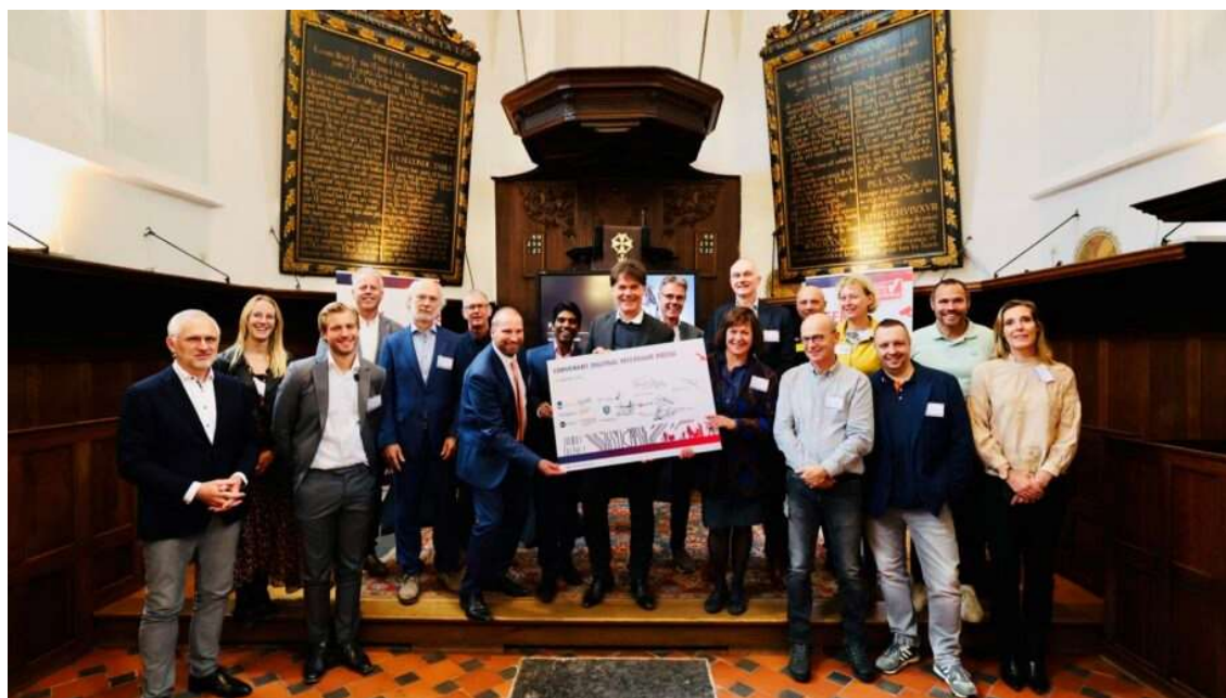
We werken maximaal samen met onze partners, zoals bijvoorbeeld blijkt uit het Convenant 'Digitaal Weerbaar Breda, Samenwerken aan een cyberweerbare Stadsregio'.

We moeten digitaal weerbaar zijn en onze eigen continuïteit garanderen, conform de Baseline informatiebeveiliging overheid (BIO). Dit vergt veel aandacht en een hoog niveau van controle over de informatievoorziening. Dit heeft impact op onze manier van werken en onze mensen, maar ook op de manier waarop we met onze partners samenwerken.