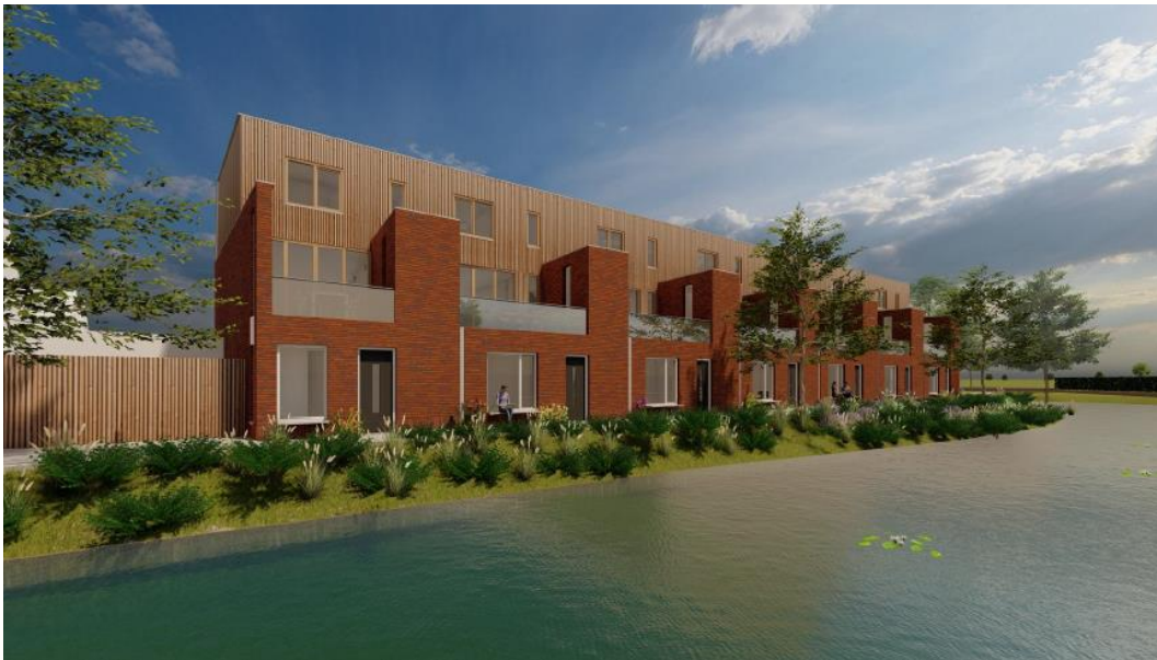
Figuur 2: aanzicht vanuit de naastgelegen waterloop

Het planvoornemen ziet toe op de ontwikkeling van zeven aaneengebouwde grondgebonden woningen in combinatie met een bestemmingswijziging van de huidige bedrijfswoning naar een reguliere woning (zie figuur 2 voor een impressie van een mogelijk eindbeeld). Het betreft daarmee een kleinschalig woningbouwplan op een plek weer voorheen reeds bedrijvigheid plaatsvond. Voor de realisatie van het plan wordt gebruik gemaakt van natuurlijke hulpbronnen in de vorm van reguliere bouwmaterialen. Daarnaast worden er naast het onoverkomelijke huishoudelijke/bedrijfsmatige afval, geen noemenswaardige milieubelastende afvalstoffen geproduceerd en wordt eventuele tijdelijke hinder als gevolg van de bouwwerkzaamheden tot een minimum beperkt. Tot slot maakt de bestemming geen functies/activiteiten mogelijk die het risico op zware ongevallen of rampen vergroten ofwel schade toe brengen aan de menselijke gezondheid.