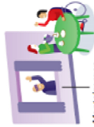
Mantelzorgers kan er even uit