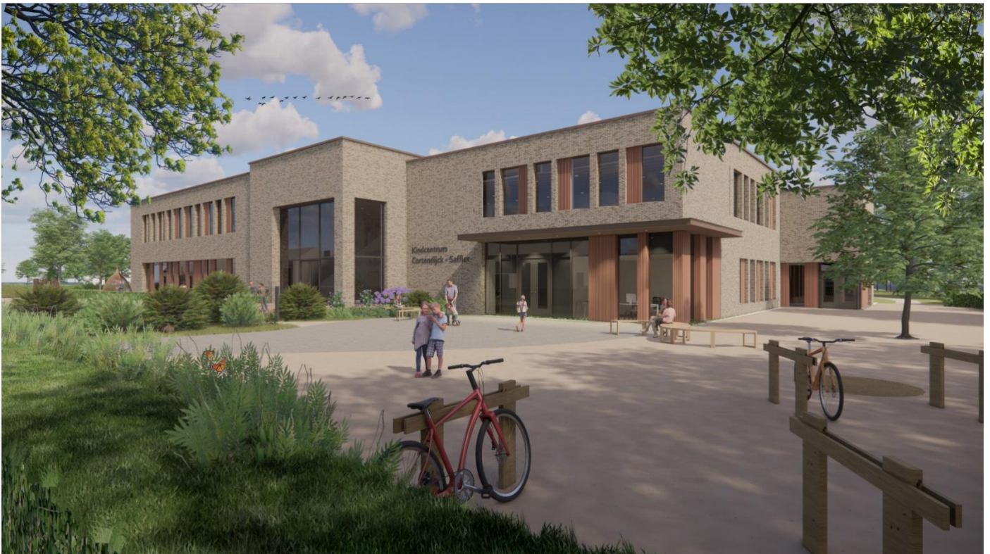
Impressie van KPO kindercentrum Cortendijk-Saffier, gezien vanaf de plaats waar het AB-pad overgaat in de Azuriedijk