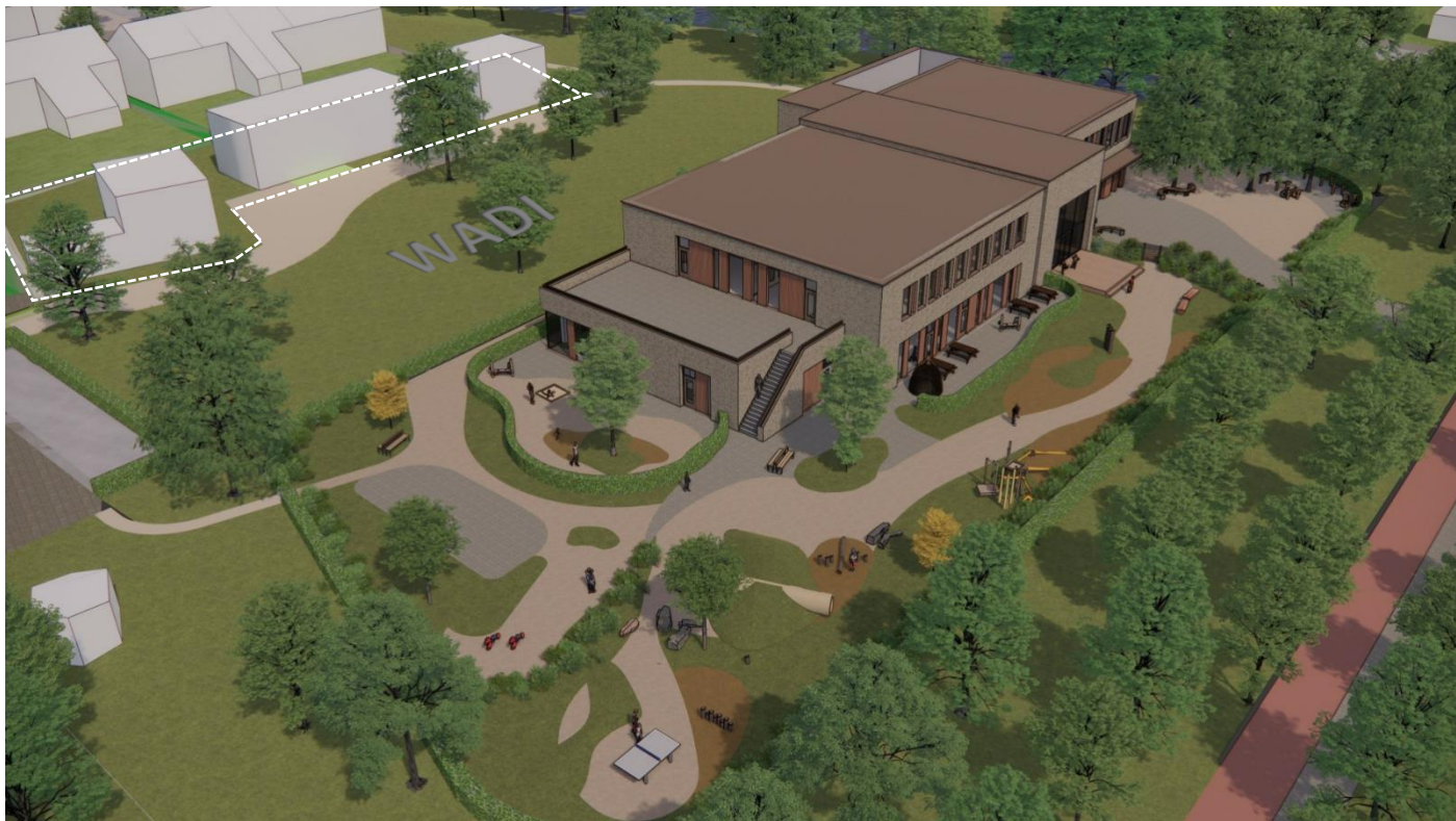
3D vogelvluchtperspectief KPO kindcentrum Cortendijck-Saffier, rondom in open verbinding met tot (ECO)campus te transformeren gebied