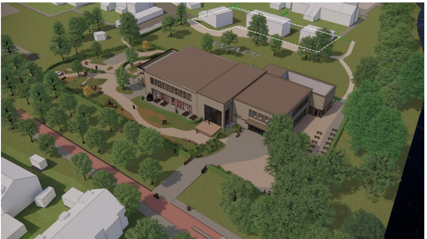
3D vogelvluchtperspectief KPO kindercentrum Cortendijk-Saffier, met aanduiding van mogelijke ontwikkeling op plaats oude schoolgebouw