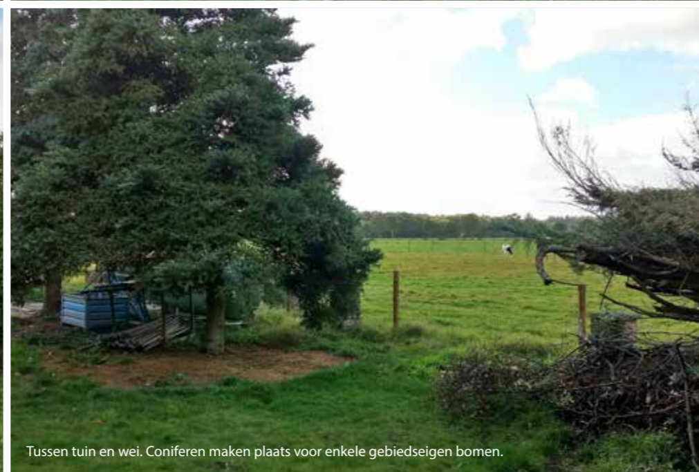
Tussen tuin en wei. Coniferen maken plaats voor enkele gebiedseigen bomen.