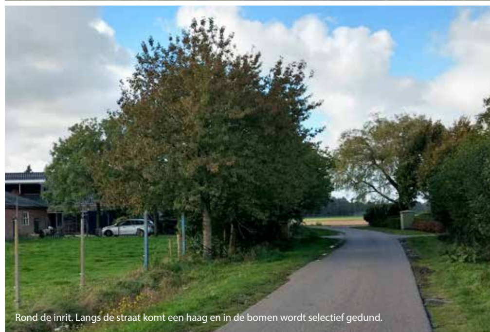
Rond de inrit. Langs de straat komt een haag en in de bomen wordt selectief gedund.