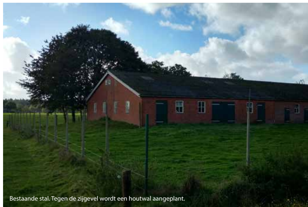
Bestaande stal. Tegen de zijgevel wordt een houtwal aangeplant.