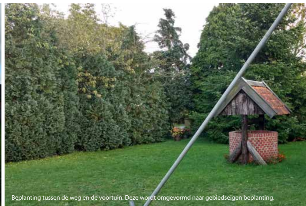
Beplanting tussen de weg en de voortuin. Deze wordt omgevormd naar gebiedseigen beplanting.