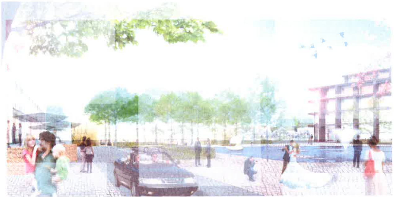
Afb: sfeerimpressie van het nieuwe plein dat HUIS van Roosendaal, Mariadal, woningbouw en binnenstad verbindt