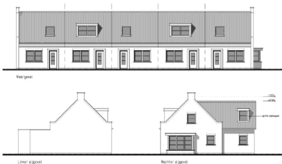
Voorgevel en zijgevels. De rechter zijgevel is de gevel zijde beukenstraat.