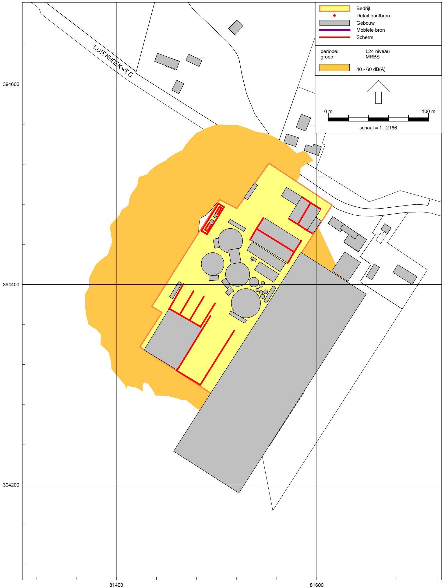
figuur 1: overzicht berekende L24 geluidcontour op 5 meter hoogte maximaal representatieve bedrijfssituatie