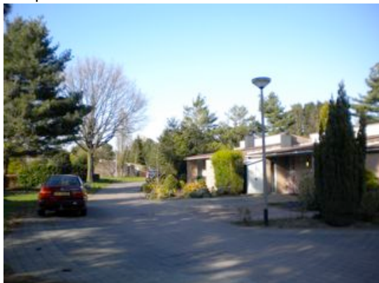
Foto 1. Covelijndijk in plangebied.

Onderdeel van de herstructurering is het slopen van de bestaande woningen en voorzieningen, om plaats te maken voor nieuwbouw. De aanvang van de sloop staat gepland voor begin 2011.