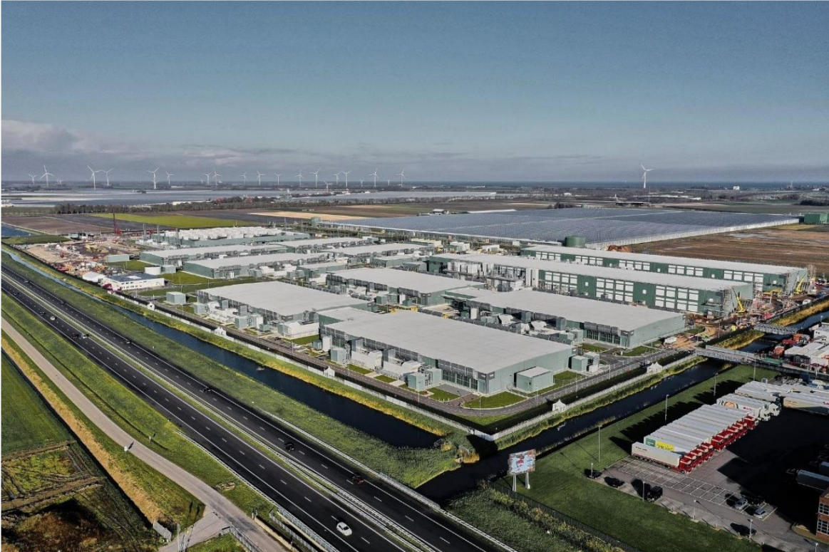
Overzicht situatie Datacenter Middenmeer 70 ha