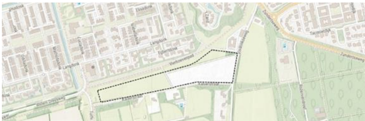
Afbeelding 1: Het plangebied tussen het Vierhoevenpad en de Kalverstraat

In de periode van juni tot november van 2023 zijn drie sessies gehouden in het kader van het inrichten van het gebied tussen het Vierhoevenpad en de Kalverstraat (zie afbeelding 1). Het doel van het proces en de werksessies was om te komen tot een toekomstbestendige invulling van de locatie die past bij het gebied en de Gemeente Roosendaal - waarbij door het college als kader meegegeven is dat er 'iets' van woningbouw moet landen in het gebied of dat een functie uit de stad in dit gebied kan landen, zodat elders ruimte voor woningbouw ontstaat. Gezien de ambities van het College moet er woningbouw toegevoegd worden, maar dit hoefde niet noodzakelijk op de Kalverstraat, mits er iets bedacht werd om elders binnenstedelijk ruimte vrij te spelen. Het doel van de participatie was om de omgeving zo vroeg mogelijk te betrekken bij het proces, binnen de meegegeven kaders, zodat deze input meegenomen kon worden naar de (interne) advisering.