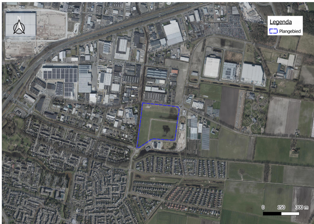
f1.1 Ligging beoogde ontwikkeling

In figuur 1.1 is de ligging van Cloetta in de omgeving weergegeven.